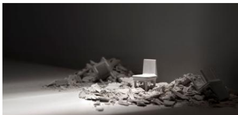
Sin título. Serie Soledades. 2014. Impresión digital de tintas pigmentadas sobre papel de algodón.