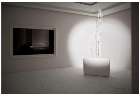
Reubicar nuestro interior. 2011 Instalación realizada en la galería Ángeles Baños